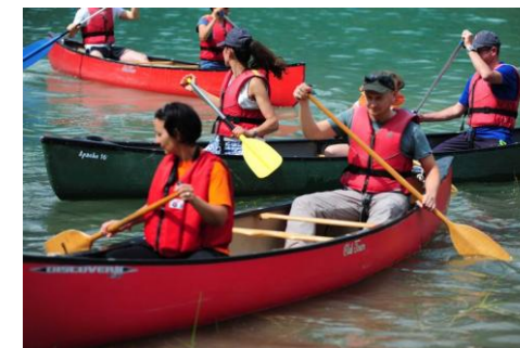
Shiatsu e Canoa Lago di Barrea 19 luglio 2014