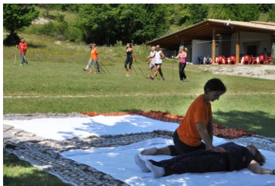
Shiatsu e Nordic Walking- Lago di Barrea 19 luglio 2014